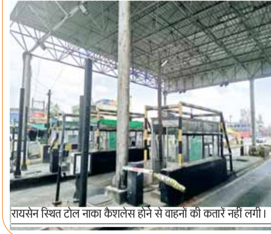
रायसेन स्थित टोल नाका कैशलेस होने से वाहनों की कतार नहीं लगी।

जिस वाहन चालक के पास फास्टेग नहीं है तो वो यूपीआई कर के अतिरिक्त लगने वाले अभिभार से बच सकता है, जिसमें अपने वाहन का क्रमांक डालते ही उसमें चार्ज दिखाए जाते हैं और उतना ऑनलाइन पेमेंट डाल कर वो टोल पास कर सकता है।