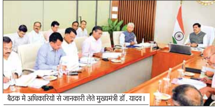
बैठक में अधिकारियों से जानकारी लेते मुख्यमंत्री डॉ. यादव।