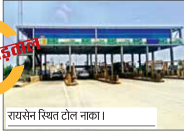
रायसेन स्थित टोल नाका।

कार और हल्के वाहनों के टोल शुल्क में करीब 5 से 10 प्रतिशत तक वृद्धि