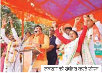
जनसभा को संबोधित करते सीएम