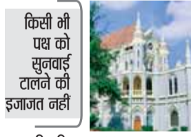
हरिभूमि न्यूज | जबलपुर

ओबीसी आरक्षण का मामला लंबे समय से अदालत में अटक हुआ था, जिससे लाखों लोगों की नजर इस फैसले पर टिकी हुई है। कोर्ट ने 27, 28 और 29 अप्रैल को लगातार तीन दिन तक सुनवाई करने का फैसला लिया है। इन