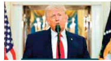
अमेरिका के राष्ट्रपति डोनाल्ड ट्रंप