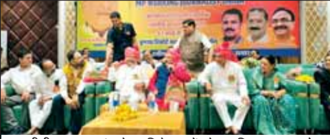
श्रमजीवी पत्रकार संघ के अधिवेशन में मौजूद विस अध्यक्ष तोमर।

मध्यप्रदेश विधानसभा अध्यक्ष नरेंद्र सिंह तोमर ने खरगोन में श्रमजीवी पत्रकार संघ द्वारा आयोजित वार्षिक प्रांतीय अधिवेशन को संबोधित करते हुए कहा कि पत्रकारिता लोकतंत्र का एक अत्यंत महत्वपूर्ण और संवेदनशील क्षेत्र है। पत्रकार समाज की आंख और कान हैं, जिनकी कलम के माध्यम से आमजन की पीड़ा, समस्याएं और अपेक्षाएं शासन-प्रशासन तक पहुंचती हैं।