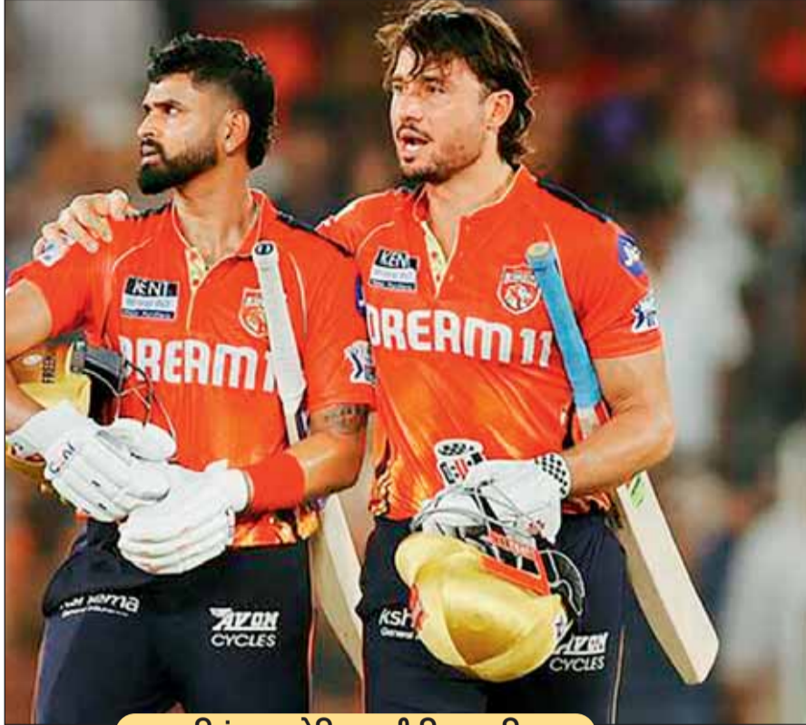
एमए चिदंबरम स्टेडियम की पिच का मिजाज

अब तक दोनों टीमों के बीच मैचों में कड़ा मुकाबला देखने को मिला है। आईपीएल में ये दोनों टीमों कुल 32 मैचों में आमने-सामने थीं, जिसमें से 16 मैच सीएसके ने जीते और 16 ही मैच पंजाब किंग्स ने अपने नाम किए। आईपीएल 2025 की दोनों भिड़त में पंजाब किंग्स ने जीत दर्ज की थी। आईपीएल 2024 में दोनों टीमों 2 मुकाबलों में आपस में भिड़ी थी, जिसमें दोनों ने 1-1 मैच अपने नाम किए थे। सीएसके को अपने पहले मैच में राजस्थान रॉयल्स के खिलाफ 8 विकेट से हार मिली थी। गुवाहटी में खेले गए उस मैच में सीएसके की टीम सिर्फ 127 रन पर सिमट गई थी। ऐसे में सीएसके अपने आगामी मैच में बल्लेबाजों से अच्छे प्रदर्शन की उम्मीद होगी।