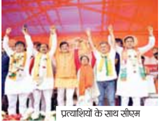
प्रत्याशियों के साथ सीएम हरिभूमि न्यूज | मोपाल

मुख्यमंत्री डॉ. मोहन यादव ने गुरुवार को पश्चिम बंगाल के बांकुरा जिले में जनसभा की। उन्होंने कार्यकर्ताओं के साथ-साथ आम जनता को भाजपा के पक्ष में वोट डालने के लिए प्रेरित किया। उन्होंने कहा कि बांकुरा में हमारे सभी प्रत्याशियों का नामांकन भरने का मौका है। यह धरती सुभाष चंद्र बोस, स्वामी विवेकानंद, गुरुदेव रवींद्र नाथ टैगोर, सुप्रसिद्ध मूर्तिकार राम किंकर की धरती है। ममता दीदी के राज में सब परेशान हैं।